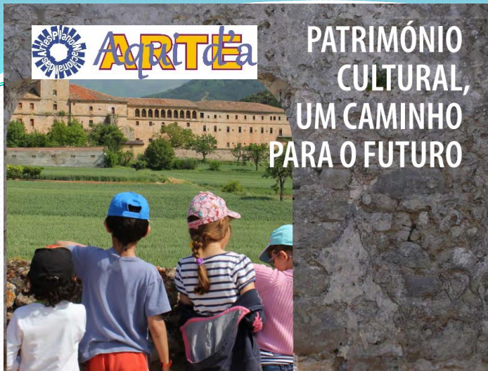
A Convenção de Faro

https://rm.coe.int/a-convencao-de-faro-patrimonio-cultural-um-caminho-para-o-futuro-/1680a3e95e